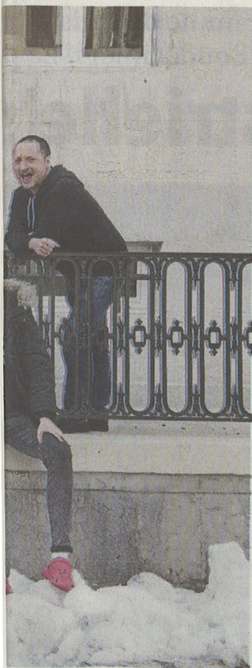
t 7e en haut de g. à dr.), éducateurs

Comme prévu, les places de stationnement rue du Cygne, derrière la BCN, et rue de la Serre sont temporairement supprimées. Les barrières mobiles seront remplacées par des palissades en dur avant la démolition de l'enveloppe. D'ici juin, on devrait commencer de creuser le futur parking de 120 places, à six mètres de profondeur. RON